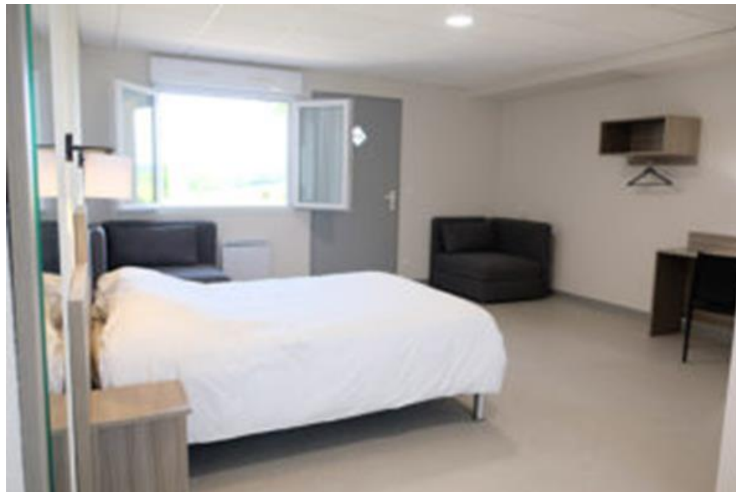
1 Chambre PMR/Familiale – Lit 160