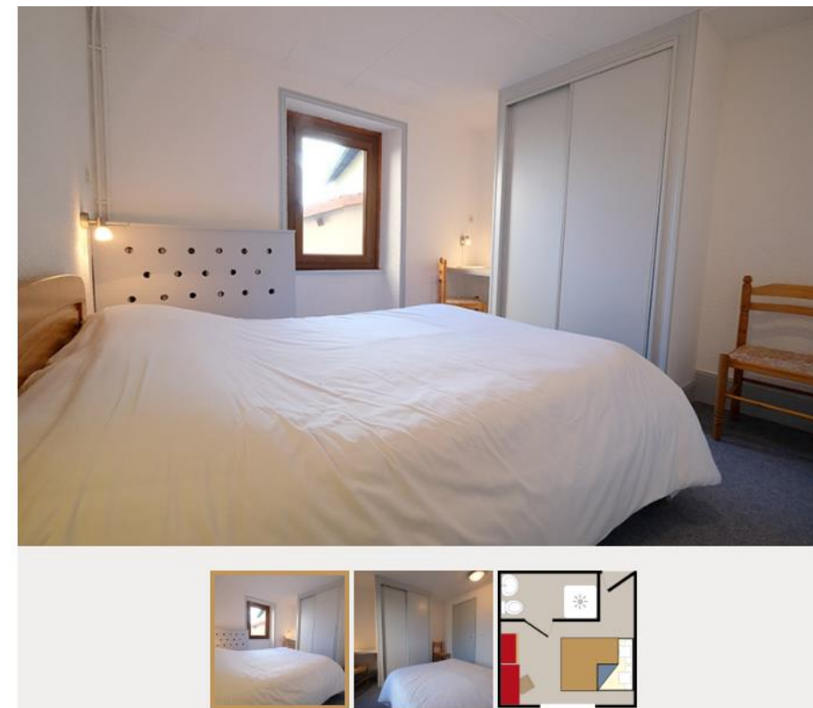
1 Chambre lit double dans gîte (ancien bâtiment)